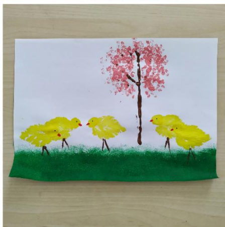
Připravila a zdokumentovala: Karolína Böhmová